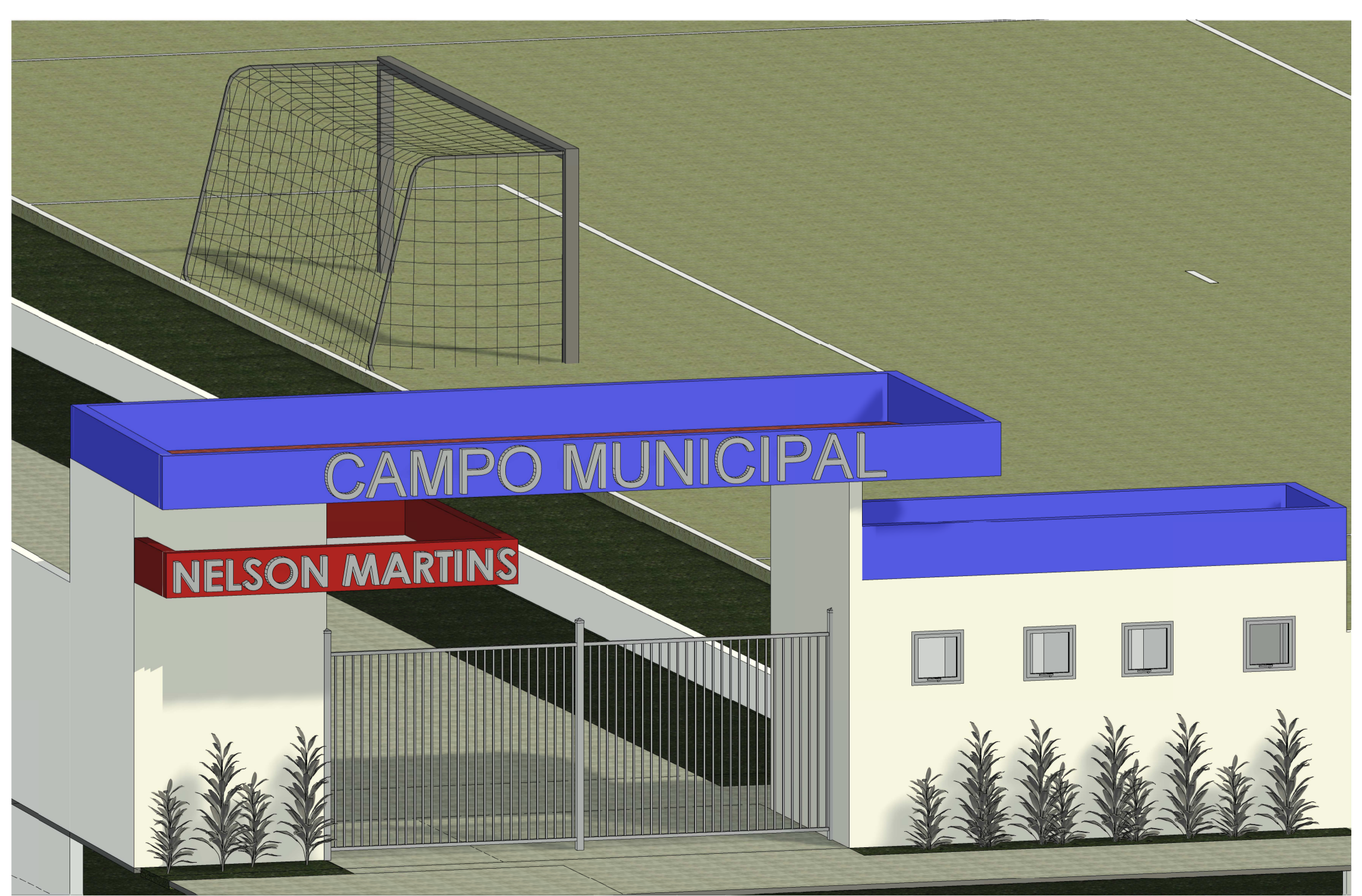
5 PERSPECTIVA 3D - PORTAL DE ENTRADA