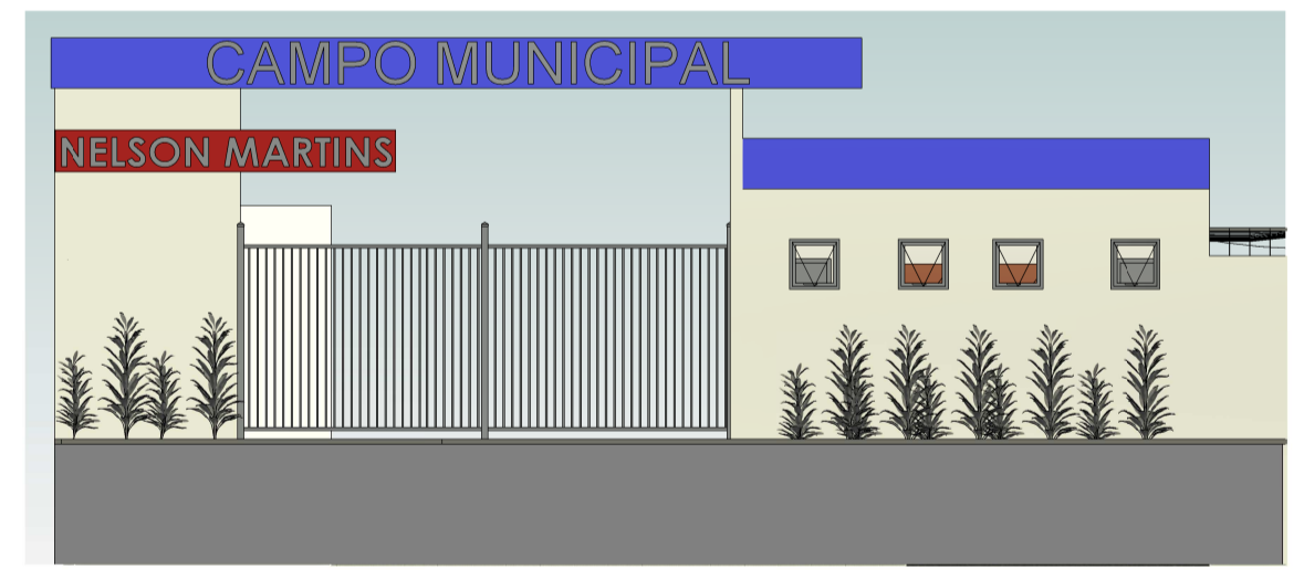
3 FACHADA PORTAL DE ENTRADA 1 : 100